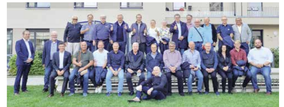
Besuch der Vereinigung der Wohnungsunternehmen in Mittelfranken

Die Vereinigung der Wohnungsunternehmen in Mittelfranken e.V. ist eine Arbeitsgemeinschaft von 50 Wohnungsunternehmen und Genossenschaften im Bayerischen Verband der Wohnungswirtschaft. Alle zwei Jahre tauschen sich Geschäftsführerinnen und Geschäftsführer sowie Vorstände der Mitgliedsunternehmen mit anderen Unternehmen aus, um sich Anregungen für Neues zu holen und Kontakte zu anderen erfolgreichen Unternehmen zu knüpfen. Am