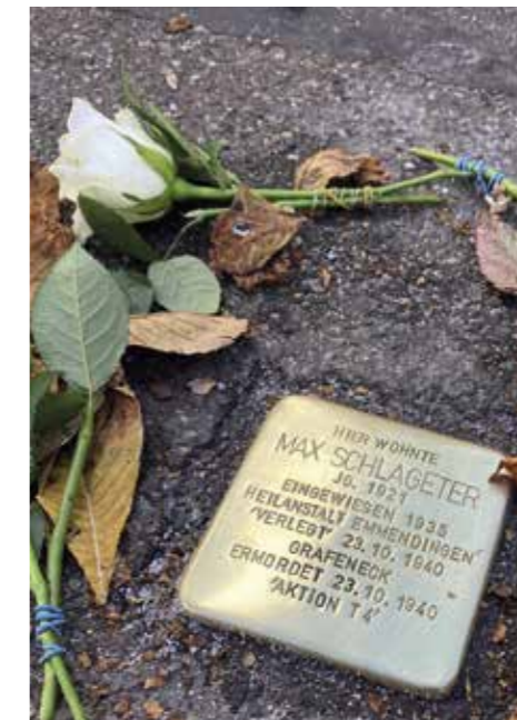
Ein „Stolperstein“ zur Erinnerung