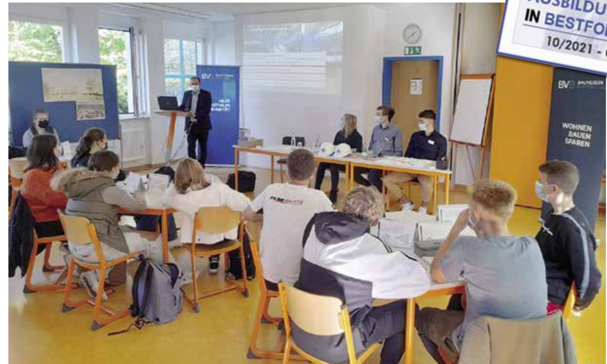
Aufmerksame Zuhörer während des Unterrichts zur Berufsorientierung

Auszeichnung für aktive und innovative Personalarbeit