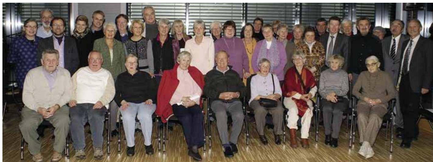
Die Gründungsmitglieder am Tag der Vereinsgründung am 17. November 2011

wir voller Freude, Anerkennung und Dankbarkeit auf die Zeit der Anfänge und der Entstehung und die wichtigsten Meilensteine der zurückliegenden zehn Jahre zurückblicken.