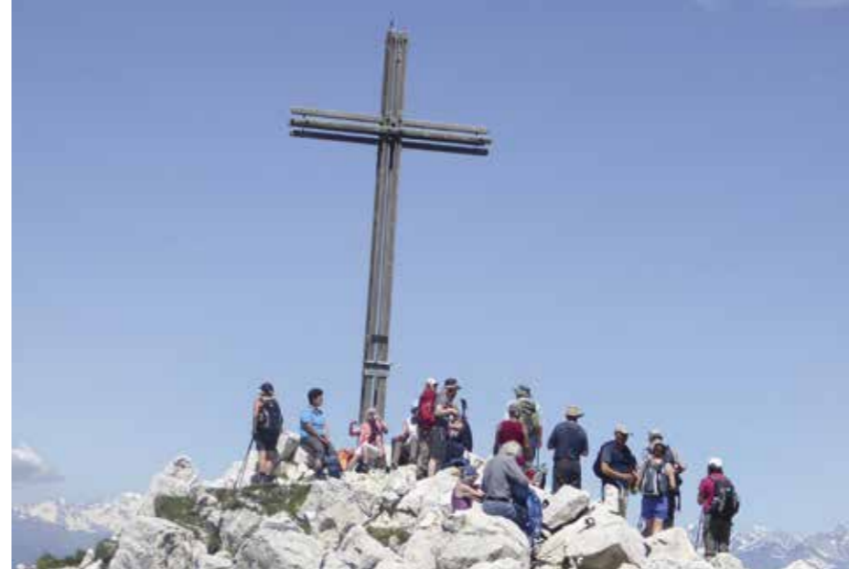
Gemeinsam Gipfel erklimmen und Aussichten genießen: Auch der steinige Wege ist manchmal das Ziel.

in Zähringen eröffnet werden. Weitere Meilensteine waren die Eröffnung und Einweihung des Quartierstreffs in Kirchzarten im Februar 2010 und des Quartierstreffs 33 im Stühlinger im März 2011.