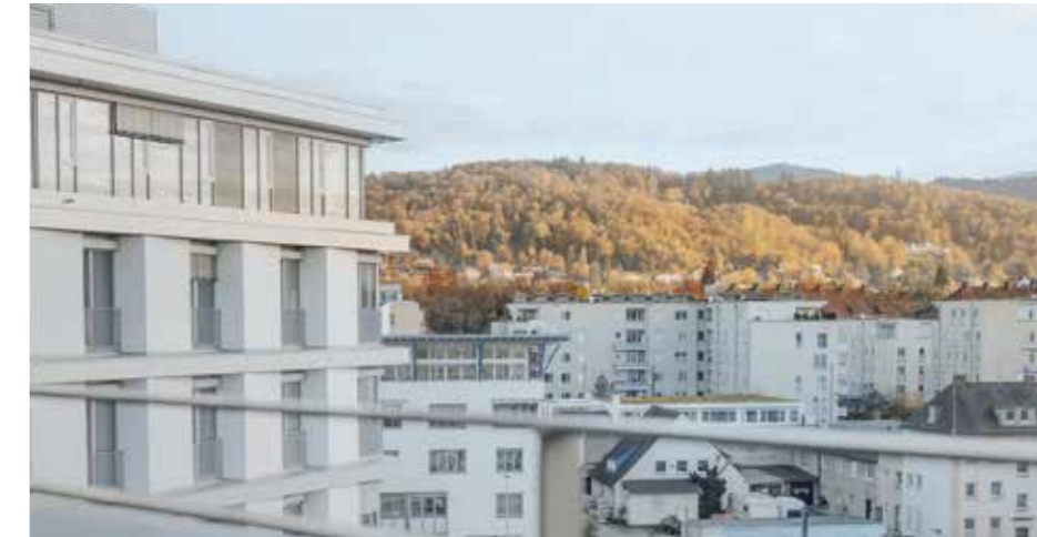
Panoramalage: Blick vom Balkon in Richtung Schlossberg