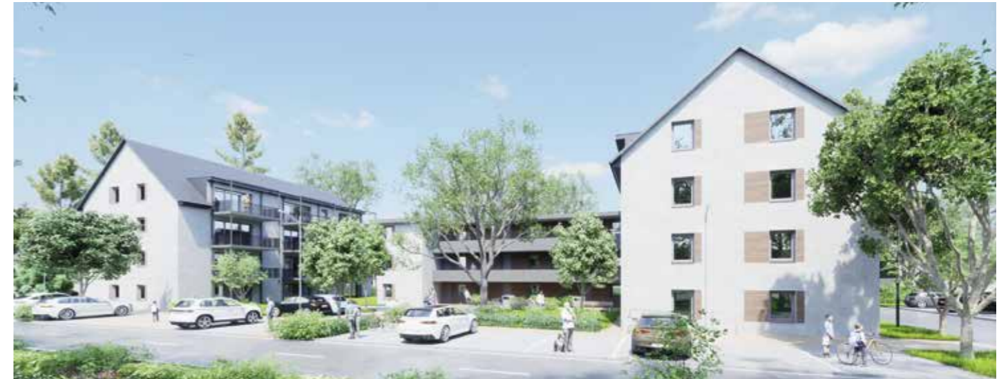
Im Laufe des Jahres 2022 - neuer Wohnraum für Herbolzheim

Die Nachfrage und der Wunsch nach Immobilieneigentum sind ungebrochen hoch und die in der Vergangenheit angebotenen Neubaumaßnahmen waren bereits in der Planungsphase ausverkauft.