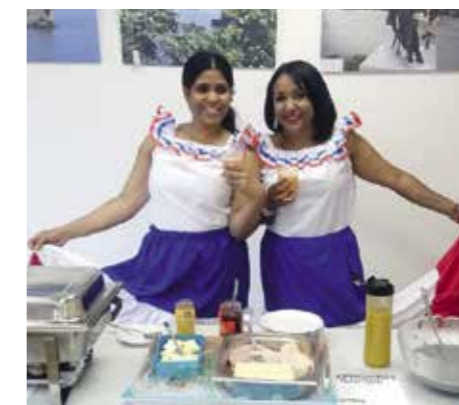
Der Quartierstreff lebt durch die Vielfalt seiner Ehrenamtlichen und ihr Engagement.

Neben den ersten Quartierstreffs in Zähringen, Kirchzarten und im Stühlinger sind im Laufe der nächsten Jahre noch die Quartierstreffs Sommerhof in Denzlingen (2014) und zuletzt im Luckenbachweg in Haslach (2017) hinzugekommen. Die Anzahl der Mitglieder stieg im Laufe der vergangenen zehn Jahre von ursprünglich 48 Gründungsmitgliedern auf über 1.200.