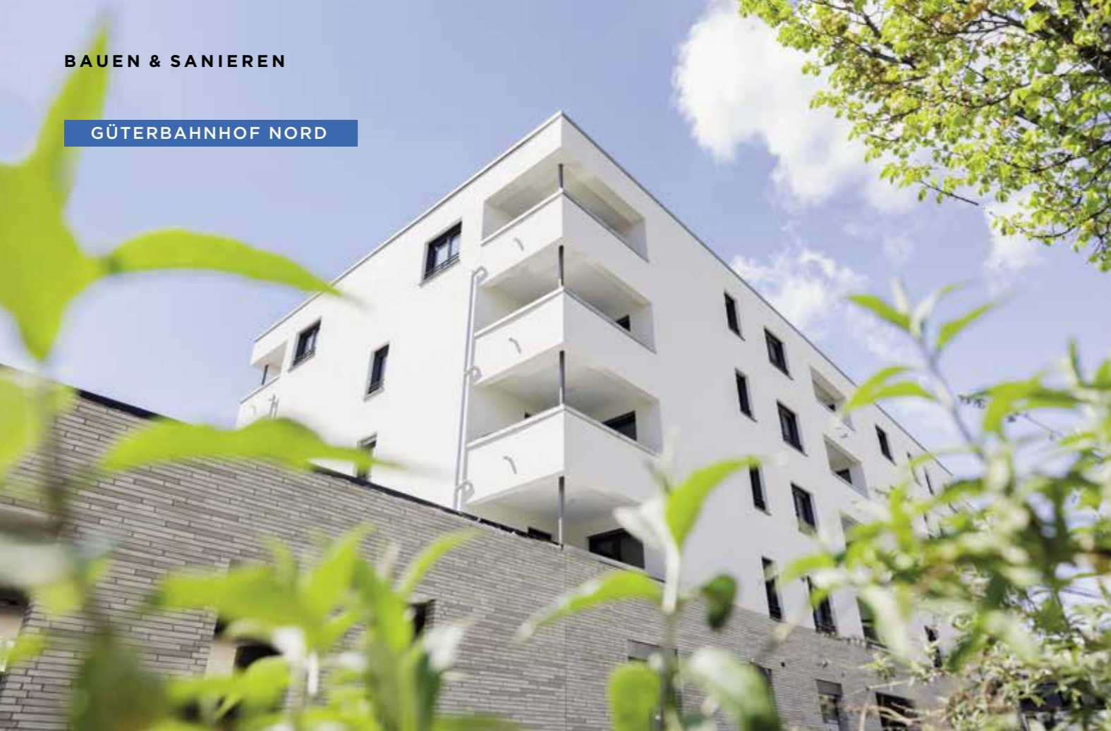
Ein großes Wohnbauprojekt für die Genossenschaft – das Güterbahndreal