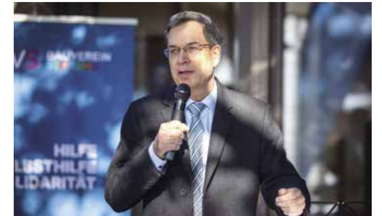
Landrat Hanno Hurth, Landkreis Emmendingen

Baumbestand berücksichtigt: Behutsam fügt sich das Haus hinter die imposanten Platanen, die im Sommer einen optimalen Schatten für die spielenden Kinder bieten. Im Herbst lädt das fallende Laub der Bäume zum Spielen und Basteln ein und die flach stehende Wintersonne kann durch die dann laublose Baumkrone strahlen. ●