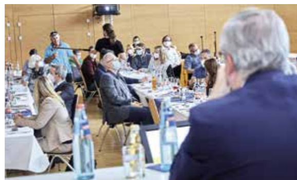
Die Vertreterinnen und Vertreter können und sollen sich aktiv an der Entwicklung der Genossenschaft beteiligen.

besichtigten rund 70 Personen zwei Vorzeigeprojekte der Genossenschaft, bei deren Konzeptentwicklung gezielt genossenschaftliches Wohnen und wohn-