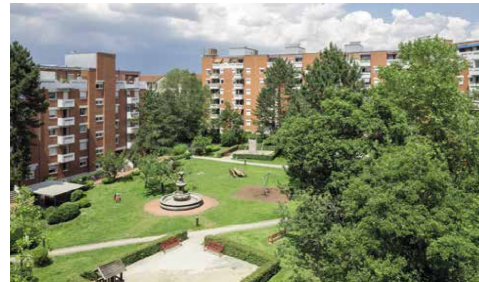
Ein Ort der Begegnung im Idinger Hof

Einem gelungenen Spielenachmittag konnten im Juli weder Corona noch Wetter etwas anhaben.