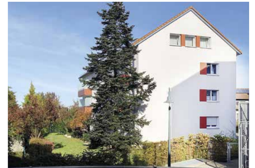
Gundelfingen, Alte Bundesstraße 45a

In Freiburg-Hochdorf in der Alten Ziegelei wurden die Fassaden der genossenschaftlichen Gebäude umfassend saniert. Die Renovierung der Treppenhäuser wird im Winter 2021/22 durchgeführt. Im kommenden Jahr erfolgt mit dem Austausch und der Erneuerung der Hauseingangstür-Elemente der Abschluss der Sanierungs- und Modernisierungsarbeiten. ●