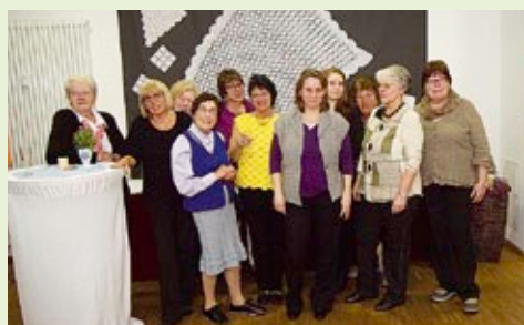
Die Ausstellung der Strickgruppe „Strick-Kunst im Qu 46“ im März dieses Jahres hatte so viel Anklang gefunden, dass die Exponate nochmals im Mai, Juni und Juli gezeigt wurden.